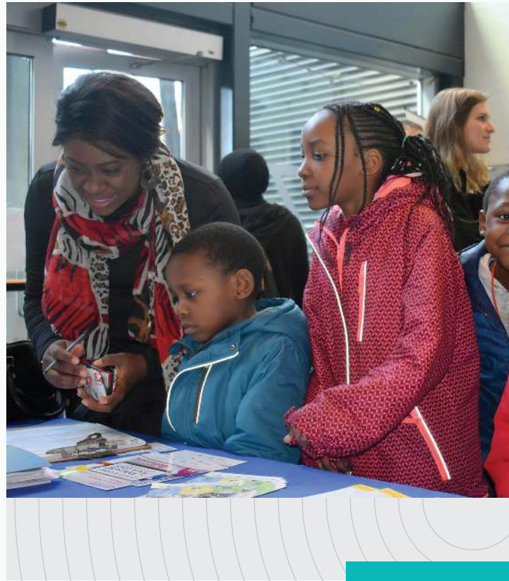
Journée d'accueil des nouveaux arrivants et réfugiés à Victoria

Pour finir, l'aboutissement des démarches entreprises par la Fédération depuis 2015 dans le but d'autonomiser les services du PIFCB s'est traduit par la création récente de la coopérative Le Relais francophone de la Colombie-Britannique, qui assurera dorénavant la gestion des services directs du PIFCB.