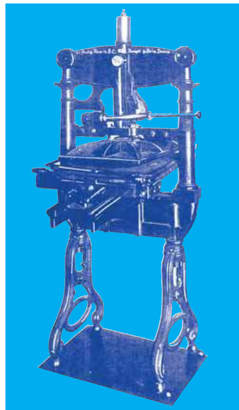
La première presse d'imprimerie en C-B. Cette presse fut apportée de France. Elle fut utilisée pour imprimer le journal Le Courrier de la Nouvelle-Calédonie .

Pendant ces années de croissance, plusieurs organisations furent également fondées à Victoria, Port Alberni, Duncan, New Westminster, etc. C'était des organisations sociales, récréatives, religieuses et théâtrales.