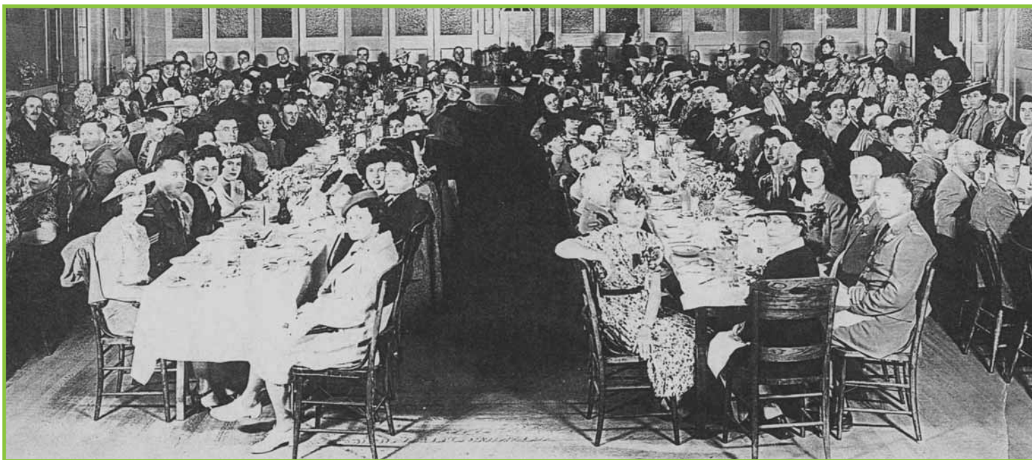
Le Congrès de fondation de la Fédération Canadienne-Française de la C.-B., en 1945.

Le « Premier congrès de langue française » fut convoqué à Victoria le 24 juin 1945 et on y forma deux comités provisoires, l'un représentant l'Île de Vancouver, présidé par